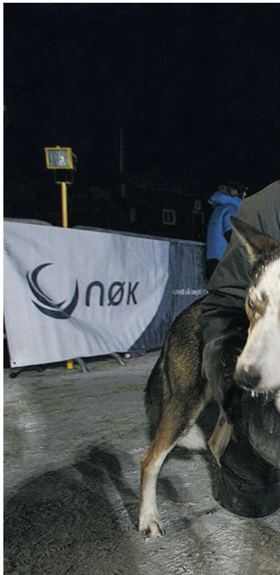
Villmarksliv og musikk har vist seg å vera ein slående kombinasjon. Dei siste åra har