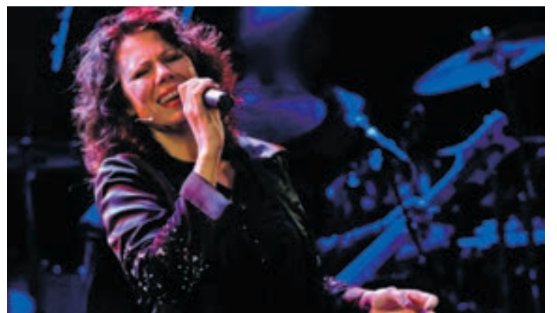
Det var sjølvtiliten og overlevelsesinstinktet Lars Monsen hadde frå villmarka som hjelte Trine Rein tilbake att til musikken.

Laurdag kl 10.00 - 18.00 Søndag kl 10.00 - 17.00