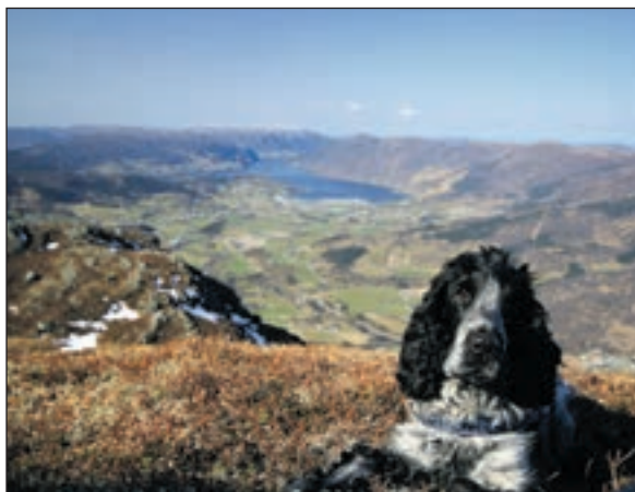
Noddy på Hodlestadnuten