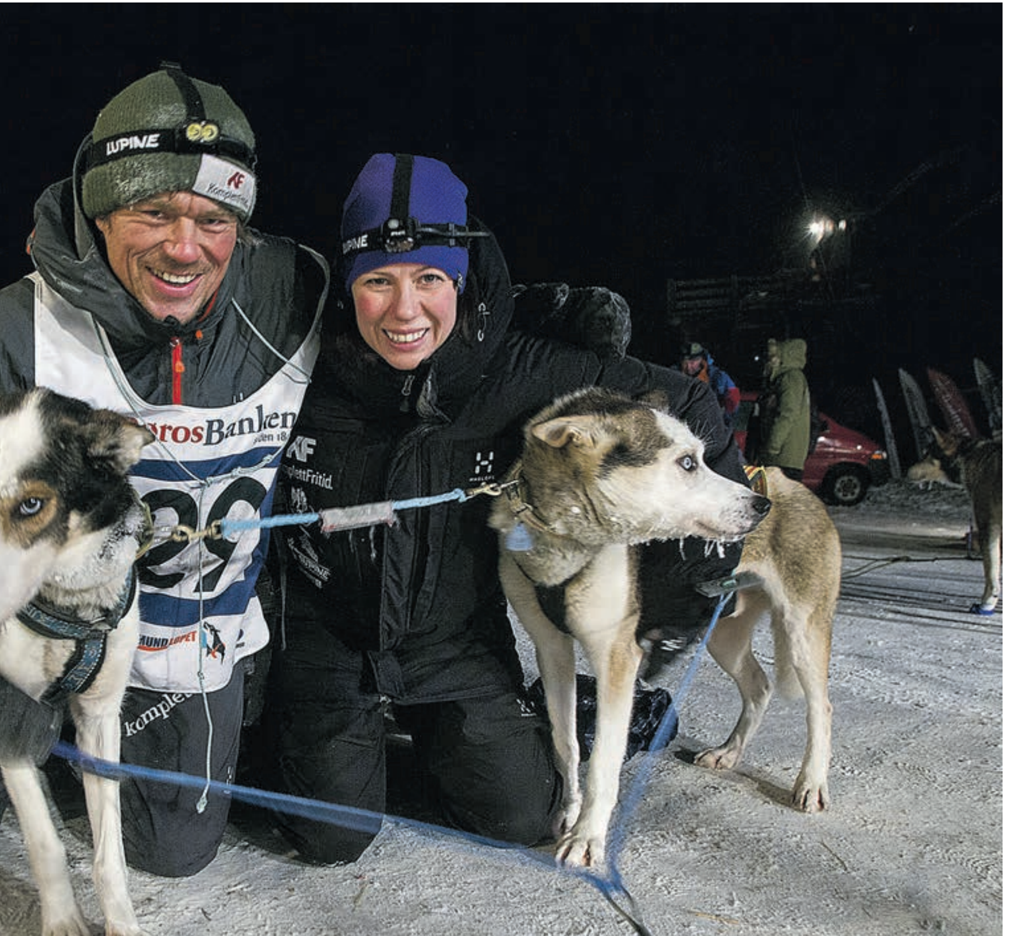
musikaren Trine Rein og eventyrrar Lars Monsen trekt fulle hus med forestillingane sine, med høgdepunkt frå kvar si karriere.