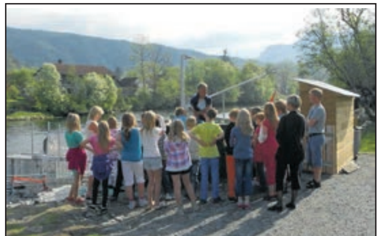
Prosjektet har utløyst eit positivt lokalt engasjement, og det finst knapt ein skuleelev i Etne og omland som ikkje har vore på klassebesøk ved fella og fått føredrag om fella og laksen sitt forunderlege liv.

Fangstsystemet har vore i bruk i mellom anna California, Oregon, Alaska og Canada, men det er første gong konseptet er testa utanfor Nord-Amerika, og første gong det er testa på atlantisk laks ( Salmo salar ) og aure ( Salmo trutta ).